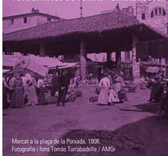
Mercat a la plaça de la Porxada, 1908.

DEL 4 DE DESEMBRE DE 2019 AL 25 DE FEBRER DE 2020 AJUNTAMENT DE GRANOLLERS. PLAÇA DE LA PORXADA, 6