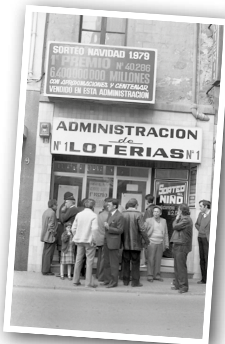
EL NÚMERO AFORTUNAT DE LA GROSSA DE LA LOTERIA NACIONAL TAMBÉ ES VA VENDRE A L'ADMINISTRACIÓ NÚM. 1 DEL CARRER DE SANT ROC.

El 22 de desembre de fa 40 anys la grossa de la rifa de Nadal va caure íntegrament a Granollers. El número afortunat va ser el 40.286 i qui es va encarregar majoritàriament de repartir la fortuna, 6.400 milions de pessetes de l'època (38.464.774,68 euros), va ser la parròquia de Fàtima, en participacions de 80 pessetes. Aleshores Granollers tenia 40.000 habitants. Aquell mateix dia, per acabar d'arrodonir la festa, l'Areslux Granollers guanyava per primera vegada al Real Madrid a la lliga de bàsquet (95-86).