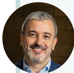
Jaume Collboni Cuadrado