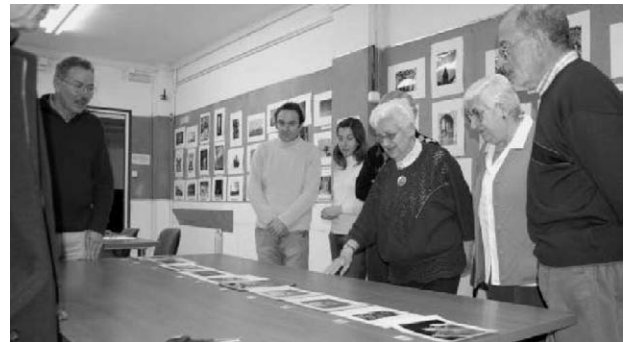
Tertúlia mensual (febrer 2008)

hi joves. És una llàstima que només hi hagi gent gran amb totes les varietats, ja sigui d'edat més avançada o pares, perquè és un ambient enriquidor. Sempre tenen alguna cosa per mostrar i és un intercanvi cultural: idees, pensaments, rialles, punts de vista diferents... Tot en un mateix sac on es congenia perfectament. D'aquesta manera, demostren que tothom hi cap. Sobtadament, eduques la vista. A què em refereixo? En la llegida visual absorbeixes altres formes, enfocaments, enquadraments, interpretacions... Tot ajuda a perfeccionar el teu estil.