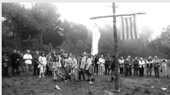
Passos a can Banyeres