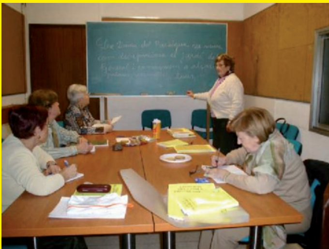
Manualitats: classes de català