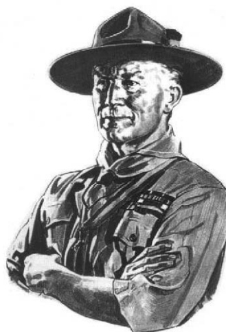
Lord Robert Stephenson Smyth Baden-Powell, I baró de Gilwell, nascut el 22/2/1857. Actor, pintor, músic, militar, escultor, escriptor i fundador del Moviment Scout Mundial per a joves exploradors de la pau.

Pel maig, un miler d'escoltes de les terres de ponent es van trobar a Linyola (Pla d'Urgell) on es va estrenar un gegant amb la figura de Baden Powell. Uns dies després eren dos-cents els escoltes celebrant el centenari Vic i a Torrelló i confegint entre tots la xifra 100 que es podia llegir des de molts centenars de metres d'alçada. A Barcelona, el 12 de maig infants i joves de totes les edats dugueren a terme activitats pròpies de cada branca fent-se presents en parcs, places i carrers de la ciutat i es van trobar més de 1.500 al passeig de Lluís Companys. Van acabar la festa amb una cançó feta per a la trobada tot brandant centenars de mans blanques per la Pau.