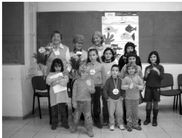
Els membres del jurat i els concursants

Com és ja tradicional des de fa una colla d'anys, també hem organitzat el concurs aquest passat mes de gener. Erem poca colla, però bons artistes. Aquí els teniu