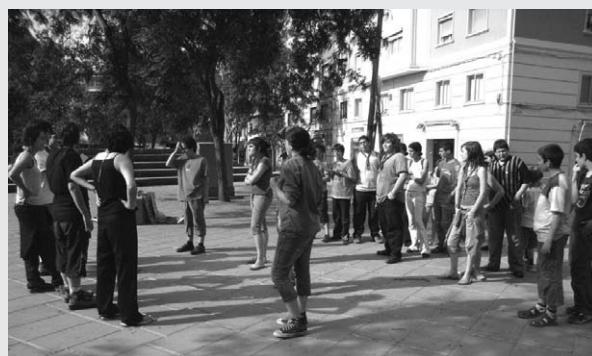
Jocs a la plaça Virrei Amat