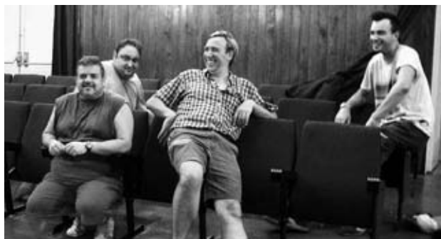
Un merescut descans