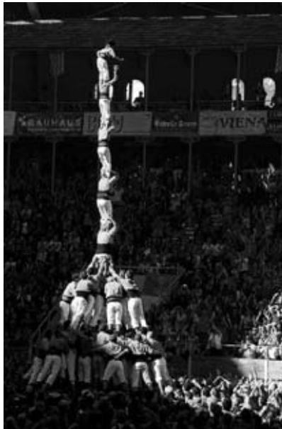
Una actuació per emmarcar.

Els Castellers de Vilafranca guanyen el Mundial casteller amb la segona millor actuació de la història dels castells.