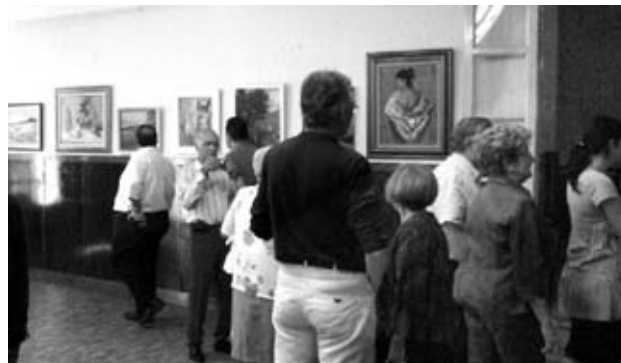
Un detall de la sala de pintura

Vam estar a l'entrega de premis de la Fotogràfica, vàrem admirar els treballs presentats i, conjuntament, vàrem passejar per la sala gran on hi havia l'exposició de pintura dels artistes de la Casa, que per cert, cada any se superen. Felicitats!