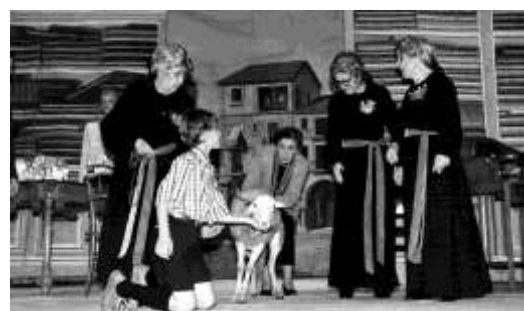
L'auca del senyor esteve (2003)