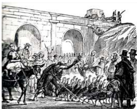
Entrada d'un ramat de galls pel Portal Nou, al segon terç del segle XIX

2007: L'Europa sense fronteres de l'espai Schengen arriba als 25 països, incorporant Estònia, Letònia, Lituània, Polònia, Hongria, la República Txeca, Eslovàquia, Eslovènia i Malta.