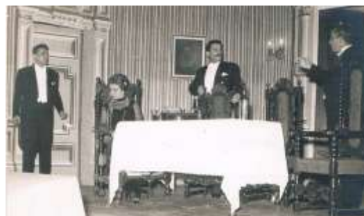
Llama un inspector (1959)