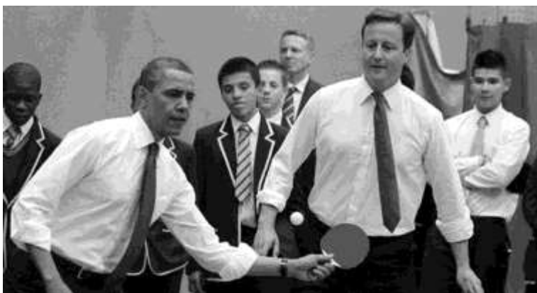
Obama i Cameron