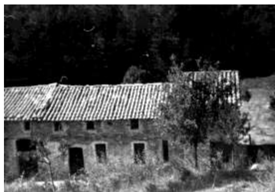
Molí del Cavaller (Vilada)