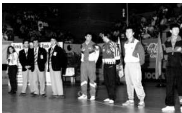
Campionat Ciutat de Barcelona al Pavelló de la Vall d'Hebron

Com que érem constants en el joc, entràrem a formar part de la Federació OAR i posteriorment de la Federació Barcelonense, de la qual encara en formo part. El fet de ser federats comporta entrenaments setmanals, partits oficials, també setmanals, campionats de Catalunya i d'Espanya.