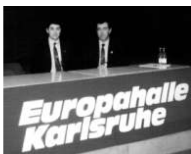
Equips d'àrbitres europeus en el Campionat de Karlsruhe (Alemanya 1997)