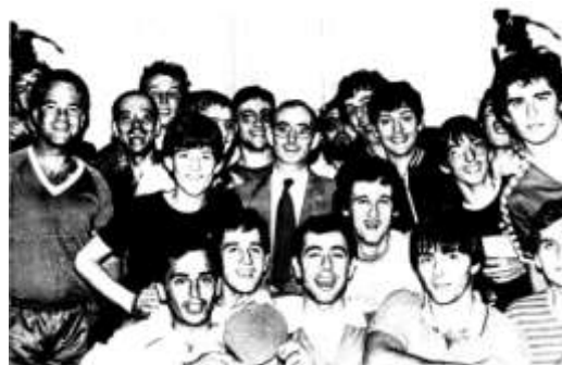
Reproducció d'una fotografia antiga