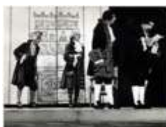
El malalt imaginari