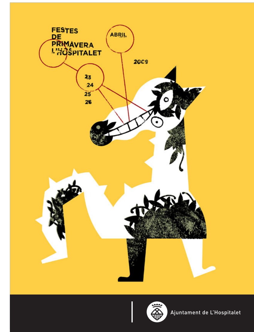
reduït al 12%