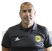
Director: Carlos Gunfaus