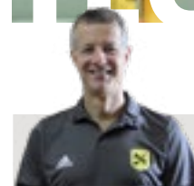
Director: Ignasi Escudé

* Setmana del 30 d'agost entrenaments amb horaris especials.