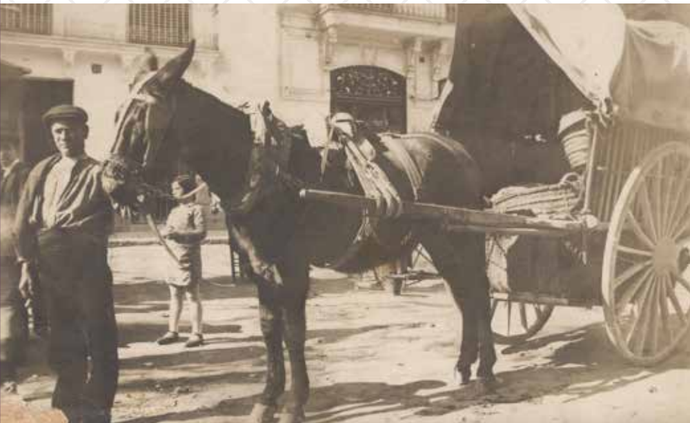
Un pagès de l'època amb el carro i el matxo

Per a explicar la situació que vivia Alcanar en el terreny agrícola els anys previs a l'adveniment de la Segona República, cal remuntar-nos més de deu anys, concretament fins al 1917. En aquelles dates, si bé la majoria del món rebia la sotragada de la Gran Guerra, aquí la situació era esplèndida. El treball era pròsper i això es reflectia en els jornals que cobraven els treballadors, que, en alguns casos, arribaven a un duro. Mentre el sagnant conflicte tenia de vermell Europa, aquí es vivia d'una manera inusitada fins aleshores. Quines són les causes d'aquesta paradoxa? L'explicació rau en la posició neutral que va adoptar el nostre país, la qual li permetia d'exportar, a bon preu, productes de primera necessitat que es-cassejaven als països bel·ligerants.