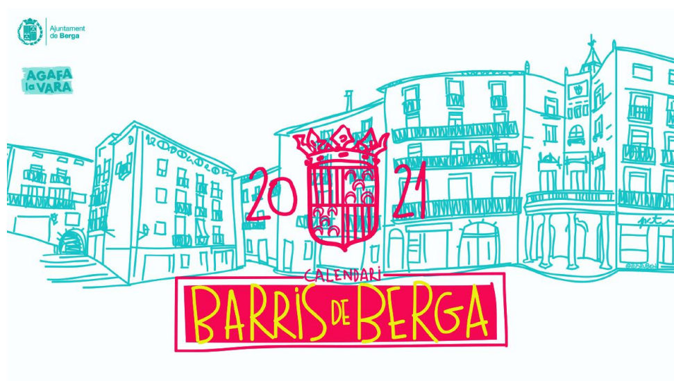
Imatge de la pàgina d'inici del Calendari 2021 de l'Ajuntament de Berga

L'Ajuntament edita, per tercer any consecutiu, un calendari en format de sobretaula, que enguany es dedica a la presentació i descripció històrica dels barris de la ciutat. Així mateix, inclou les festes, fires i altres esdeveniments que organitza l'Ajuntament durant l'any en curs.