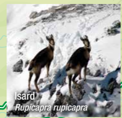
Isard Rupicapra rupicapra