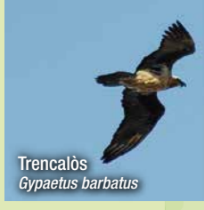
Trencalòs Gypaetus barbatus