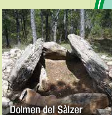
Dolmen del Sàlzer