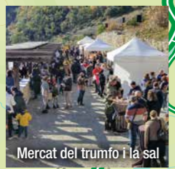
Mercat del trumfo i la sal