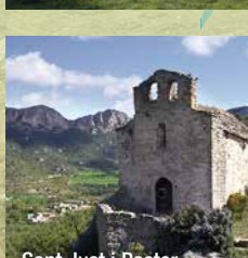
Sant Just i Pastor