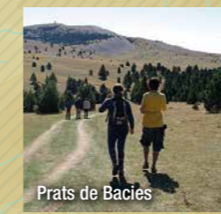
Prats de Bacies

Estació d'esquí de fons Tuixent-la Vansa