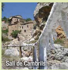
Salí de Cambrils