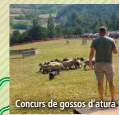
Concurs de gossos d'atura