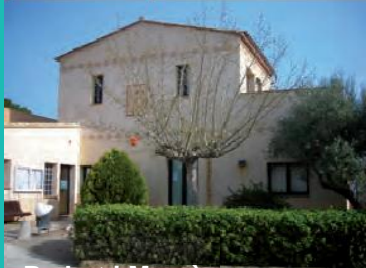
Pedret i Marzà