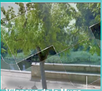
Vilanova de la Muga