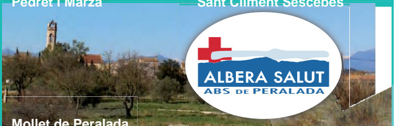
Mollet de Peralada