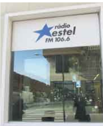
■ Darrere aquesta finestra hi ha l'estudi des d'on s'emet el programa sardanista.