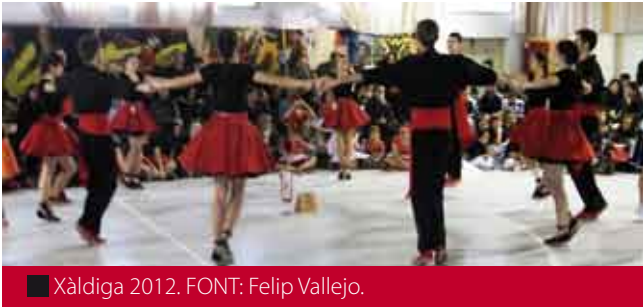
■ Xàldiga 2012. FONT: Felip Vallejo.

Passem ara a la categoria de més edat, on trobem com a Campiona de Catalunya Veterana 2012 la colla Toc de Dansa (Tarragona) amb sis primers, dos segons, un tercer i un tercer empatat. La segona posició, molt disputada, ha estat per a Sabadell (Sabadell) amb un primer, un primer empatat, tres segons, un segon empatat, un tercer, dos tercers empatats i un quart. Just a continuació hi trobem les Roques Blaves de La Passió (Esparreguera) amb un primer, un primer empatat, dos segons, un segon empatat, dos tercers, un tercer empatat i dos quarts. La quarta posició se l'ha adjudicada Ressò (Sabadell) amb dos primers empatats, dos tercers, dos tercers empatats i quatre quarts. Finalment els Dansaires de Maig (Barcelona) han obtingut la cinquena posició a tots els concursos que han disputat.