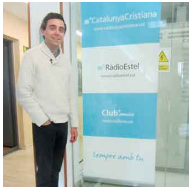
■ En la recepció de Ràdio Estel.

■ El programa s'emet cada diumenge al matí de 9 a dos quarts d'11 i n'estic content perquè hi participa molta gent de tot Catalunya i Andorra. En el