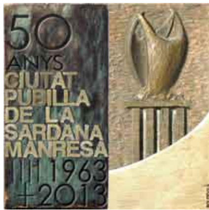
Manresa 50 anys de Ciutat Pubilla