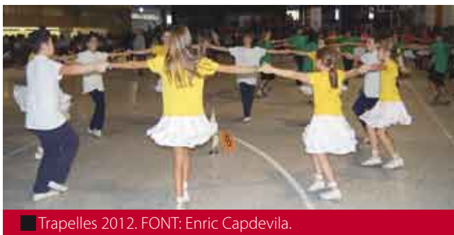
Trapelles 2012.

Tal com s'ha esdevingut en les darreres temporades, els més menuts han competit a un únic concurs celebrat a Valls el passat 18 de novembre amb un total d'11 colles alevines participants. Trapelles (Sabadell) i Trèvol (Vic) s'han repartit un primer i un segon llocs a les dues sardanes, una situació idèntica a la viscuda per la majoria de colles de la categoria en les seves respectives posicions: Xamosa (Barcelona) i Xerinola (Tarragona) s'han repartit el tercer i el quart llocs; Petits Laietans (Barcelona) i Terrabastall (Sant Vicenç dels Horts), la cinquena i sisena posicions; el setè i el vuitè, entre Petits Amunt i Crits (Terrassa) i Montgrí Mini (Torroella de Montgrí); el novè i el desè, entre Petits Vilanovins (Vilanova i la Geltrú) i Escarlata (Lleida). En l'onzè lloc hi tenim la Quitxalla de Galzeran (Rubí).