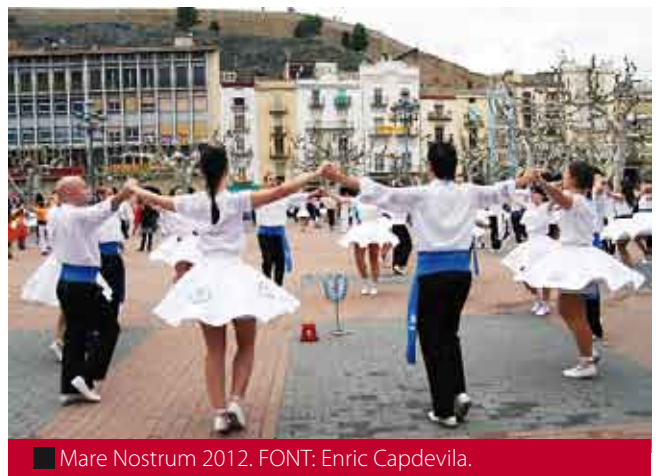
■ Mare Nostrum 2012. FONT: Enric Capdevila.

final de Balaguer. Una mica més avall hi trobem la colla Maig (Barcelona) amb set segons, tres tercers, un quart i un cinquè a la primera fase, i un tercer i dos quarts a la final. El quart lloc del Campionat ha estat per a Tarragona Dansa (Tarragona) amb un segon, un segon empatat, sis tercers, dos tercers empatats i dos quarts a la primera fase, i dos tercers i un quart a la final. En cinquena posició, l'Encís (Manlleu) amb un segon empatat, un tercer, un tercer empatat, quatre quarts, tres cinquens, un cinquè empatat i un vuitè a la primera fase, mentre que a Balaguer han obtingut tres cinquenes posicions. Al sisè lloc, les Mans Amigues (Cassà de la Selva) amb cinc quarts, quatre cinquens i tres sisens a la primera fase, i dos primers i un segon a la Final B de Balaguer. La Mirant al Cel (Sabadell), en setè lloc, ha obtingut un quart, sis cinquens, un cinquè empatat i quatre sisens a la primera fase, i un primer i dos segons a la Final B. A la vuitena posició hi tenim la Blanca Espurna (Sitges) amb quatre sisens, dos setens i sis vuitens a la primera fase, i tres tercers a la Final B de Balaguer. En novena posició, la Riallera (Vic) amb dos sisens, vuit setens i dos vuitens a la primera fase, i tres quarts a la final B. Finalment trobem la colla Dolç Infern (Lleida) amb un sisè, cinc setens i sis vuitens a la primera fase, i tres cinquens a la final B de Balaguer.