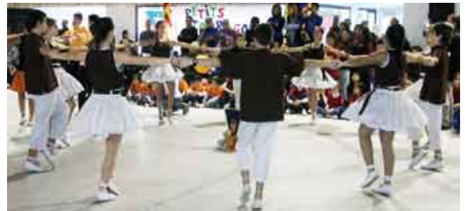
Petits Tarragona Dansa 2012.

de Catalunya Infantil 2012 hi tenim els Petits Tarragona Dansa (Tarragona) amb un total de sis primers llocs, un segon i un segon empatat. En segona posició hi tenim la Guspira (Lleida) amb dos primers i sis segons, i en tercer lloc els Petits Galzeran (Rubí) amb un segon empatat i set tercers.