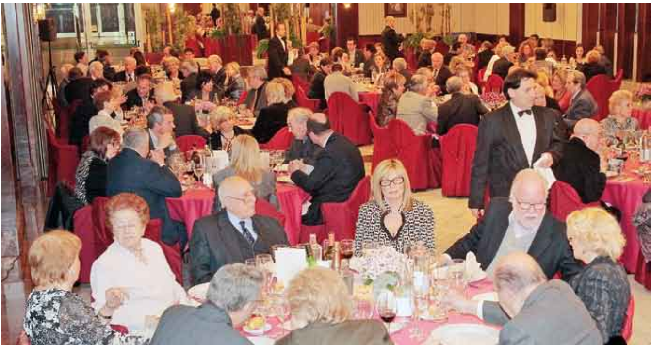
■ Una vista dels assistents.

El guardonat Jordi Saura i Tarrés va tenir paraules d'agraïment pel premi que se li concedí i es comprometé a seguir aquesta línia del programa que s'emet tots els dissabtes per Ràdio Sabadell i que és a prop d'arribar a les 400 edicions juntament amb un altre programa paral·lel que s'emet els diumenges a la mateixa hora, les 9 del matí. Va venir a dir que a més d'oferir música i informació, els seus programes són un vehicle que li permet treballar pel catalanisme del país. ■