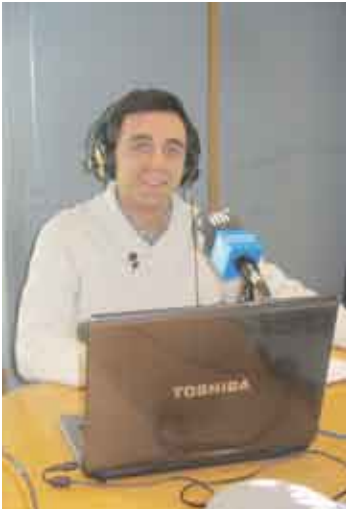
■ En Gerard enfeinat.

programa la música de sardanes és la protagonista, és el format que proposem, a més volem que la gent hi participi amb comentaris, suggeriments o propostes que volem que ens facin arribar mitjançant, telèfon, correu electrònic o facebook. Tots els programes emesos aquesta temporada, des del mes de setembre passat, es poden