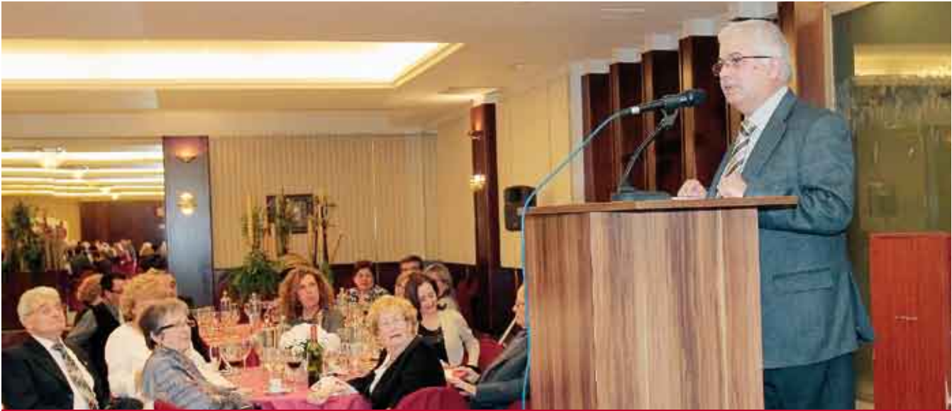
■ Parlament del Sr. Jordi Saura.

El diputat Carles Rossinyol es lamentà de les negatives a contracor que ha de donar a entitats que cerquen ajuts, les retallades arriben a tothom.