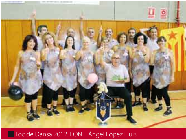
■ Toc de Dansa 2012.

Passem ara a la categoria de més edat, on trobem com a Campiona de Catalunya Veterana 2012 la colla Toc de Dansa (Tarragona) amb sis primers, dos segons, un tercer i un tercer empatat. La segona posició, molt disputada, ha estat per a Sabadell (Sabadell) amb un primer, un primer empatat, tres segons, un segon empatat, un tercer, dos tercers empatats i un quart. Just a continuació hi trobem les Roques Blaves de La Passió (Esparreguera) amb un primer, un primer empatat, dos segons, un segon empatat, dos tercers, un tercer empatat i dos quarts. La quarta posició se l'ha adjudicada Ressò (Sabadell) amb dos primers empatats, dos tercers, dos tercers empatats i quatre quarts. Finalment els Dansaires de Maig (Barcelona) han obtingut la cinquena posició a tots els concursos que han disputat.