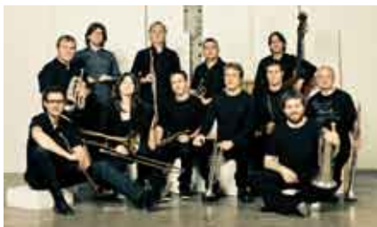
Cobla Sant Jordi-Ciutat de Barcelona