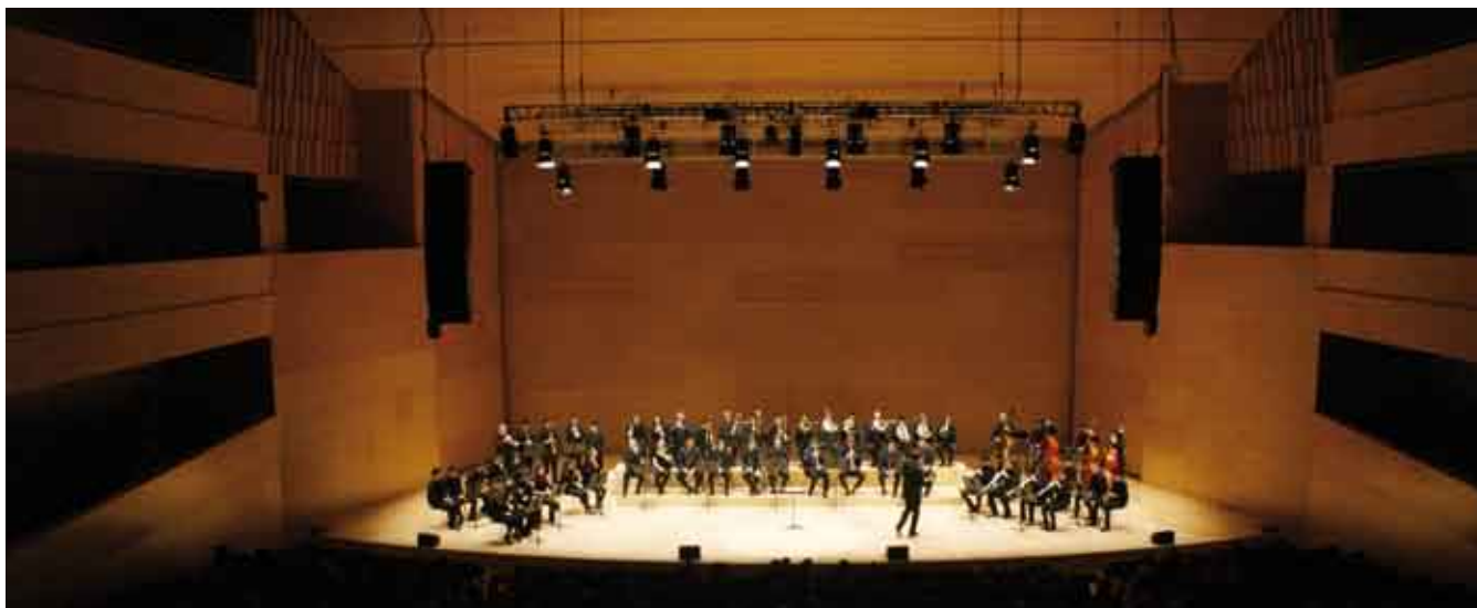
■ La Cobla del futur & La Principal de la Bisbal

Una fórmula ben enginyosa triada per la cobla bisbalenca, que porta a esperonar el jovent a apujar la guàrdia de la seva formació com a instrumentistes, i a adonar-se que és possible acostar-se a la flor i nata dels intèrprets actuals, i que el futur de les formacions passa per ells, i que per aconseguir-ho, com a totes les feines i més les artístiques, l'esforç del dia a dia i l'evolució personal ha de ser constants. ■