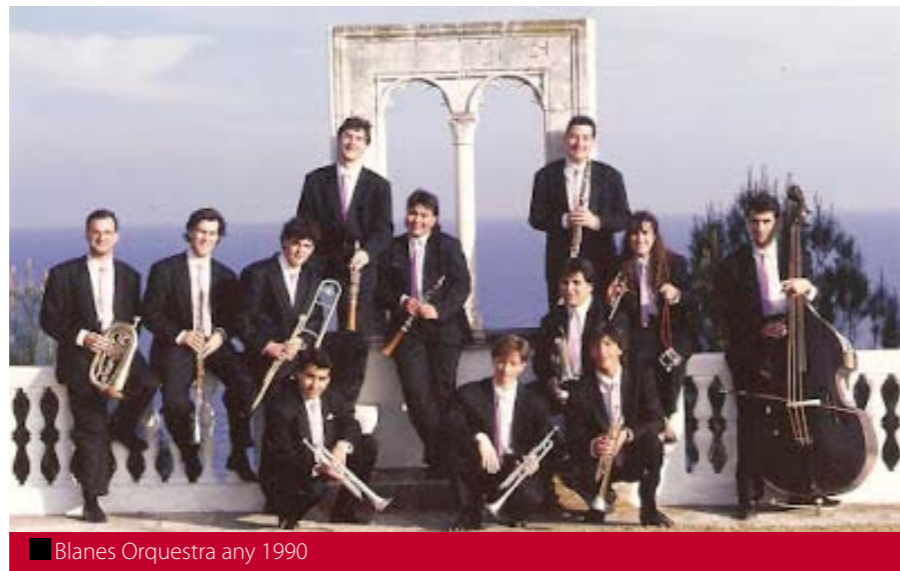
■ Blanes Orquestra any 1990

■ Ens has dit que sempre has actuat com a fiscorn segon, però recordes quins han estat els primers fiscorns amb qui has format parella fins al present any?