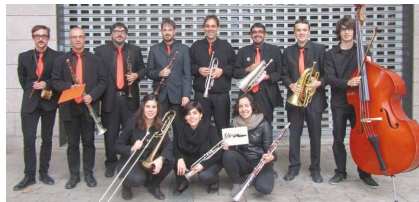
Formació actual de la cobla Catània

És previst que la cobla Catània faci alguns actes per commemorar els seus primers 25 anys, així, han pensat enregistrar un CD amb sardanes vinculades al Penedès, també efectuaran un parell de concerts i alguna ballada. És possible que el compositor Àlex Cassanyes els escrigui una sardana dedicada per commemorar l'aniversari. Moltes felicitats a la cobla Catània pels seus primers 25 anys. ■