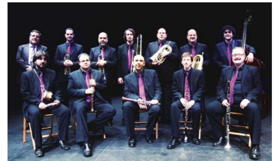
■ Formació actual de la cobla Ciutat de Girona