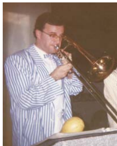
■ Amb el trombó de vares amb la cobla orquestra Vila de Blanes. Any 1990