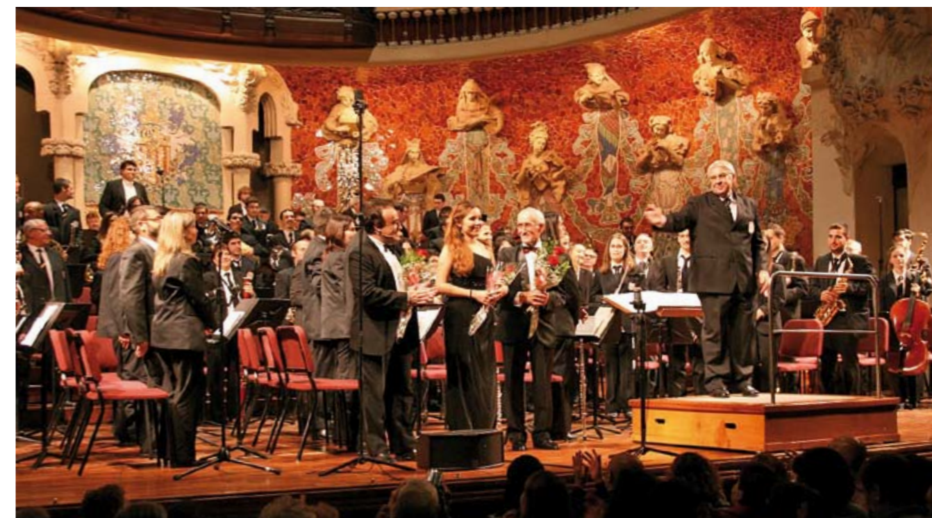
Fotografies d'en Francesc Botet