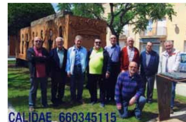
Els membres del grup Calidæ

deia Ciutat de Barcelona i com hem dit abans, després d'alguns problemes es va dir Orquesta Ciudad de Barcelona, era l'any 1967, després va ser l'orquestra Ciutat de Barcelona i després Orquestra Nacional de Catalunya. En entrar la Generalitat també hi va voler participar i es va dir Orquestra Simfònica de Barcelona i Nacional de Catalunya i com que el nom era molt llarg va quedar com a OBC. Durant aquests anys a l'orquestra de Barcelona us diré que vaig actuar 10 anys a l'Orquestra del Liceu i les alternava totes dues. Érem una vintena de músics de l'orquestra de Barcelona que anàvem a ajudar l'Orquestra del Liceu (que no actuava gaire) perquè hi havia molta manca de músics preparats. Però allò era molt pesat, jo ja donava classes i els vaig dir als responsables de l'Orquestra del Liceu que