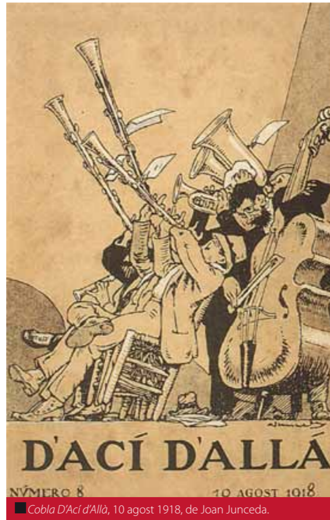
■ Cobla D'Ací d'Allà, 10 agost 1918, de Joan Junceda.

(Il·lustració cedida per La Fundació Universal de la Sardana) ■