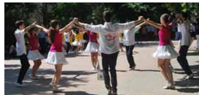
Colla Cabirols a Cardedeu

(**) Assignació d'un últim lloc i una mitjana al concurs de Lleida