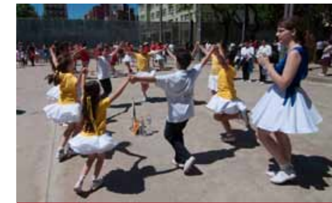
Colla Trapelles al concurs de Barcelona - Poble Nou

El Campionat consta de 2 concursos: La Semifinal, el 20 de setembre a Sitges i la Final, el 15 de novembre a Valls, amb les 3 primeres colles classificades. ■