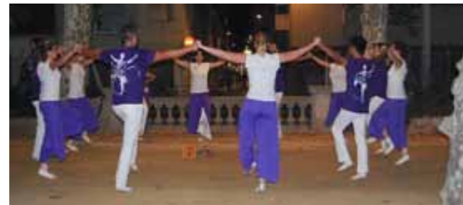
Colla Violetes del Bosc a Calella

En la categoría absoluta , els concursos de repesca han estat els de Calella, el 20 de juny, i Vic, el 14 de juliol. Un cop acabada aquesta fase, a les colles classificades directament per a la Final A en la fase prèvia, Mare Nostrum, Tarragona Dansa i Xàldiga, s'hi han afegit la Mans Amigues, Mirant al Cel i Violetes del Bosc.