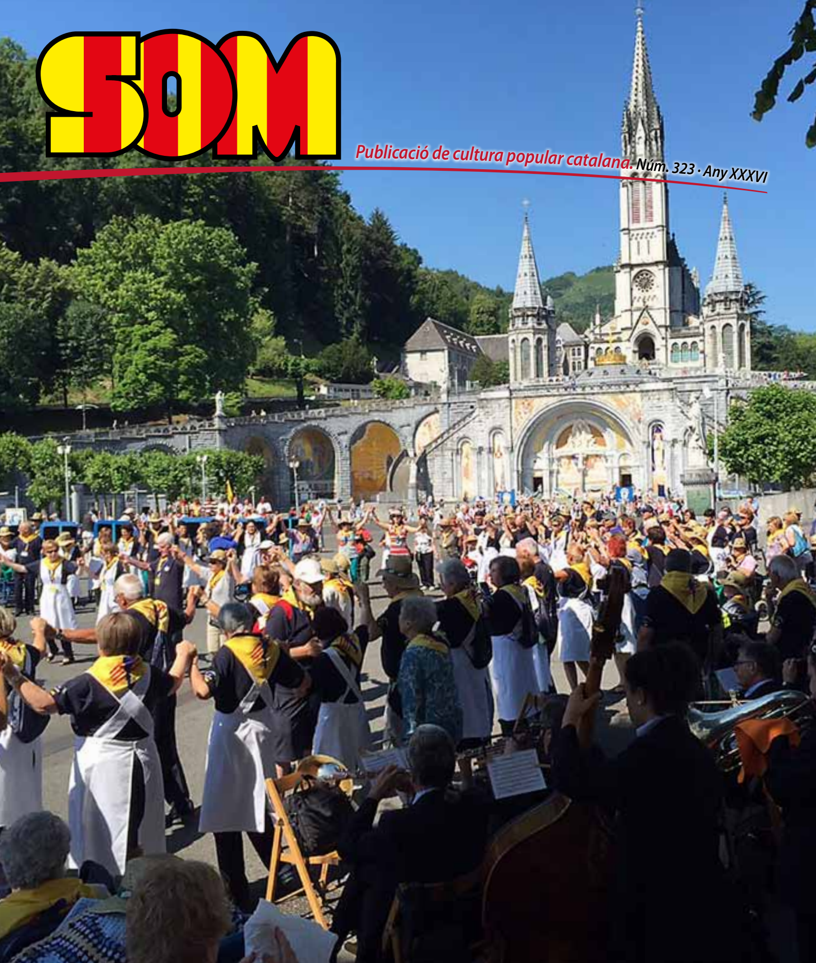
Sardanes a Lourdes

Publicació de cultura popular catalana. Núm. 323 · Any XXXVI