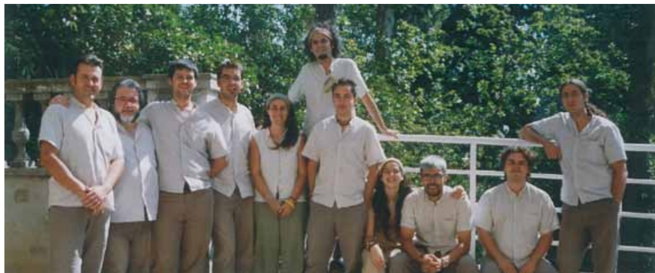
Formació de la cobla Marinada de l'any 2006, any del seu 25è aniversari.