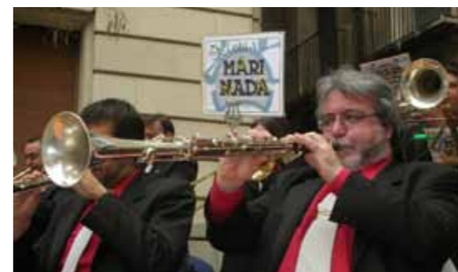
El conegut tenora de la cobla Marinada en plena actuació.

tenora construïda per Miquel Puigdemívol de Mataró i fa alguns anys utilitzava un exemplar de l'antiga casa Catrio. A continuació fem un repàs a la seva biografia i sabrem més coses d'ell.