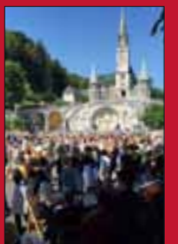
Lourdes. Sardanes davant l'esplanada de la Basílica.