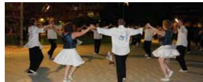
Colla Ressò al concurs de Vilanova i la G.

Joventut Sardanista i Ressò han superat aquesta fase i s'afegiran a la Sabadell i Roques Blaves a la final A. Aires Gironins i Entre Boires competiran en la Final B amb la colla Dansaires de Maig.