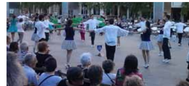
Colla Montgrí 2000 a Reus