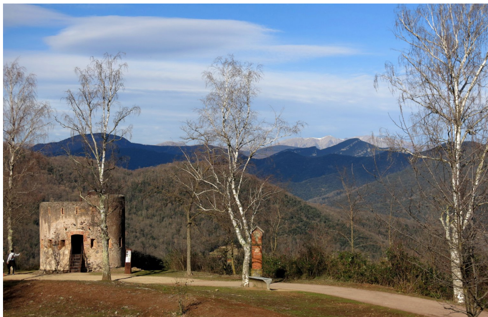
Senderisme (pàg.6) El Canigó dels del Montsacopa.