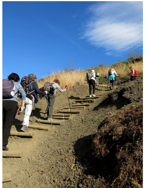
Pujant al Montsacopa.

D esprés de baixar un munt d'escales, caminem pels carrers tot travessat Olot, per anar al peu del Volcà Montsacopa, on ens espera