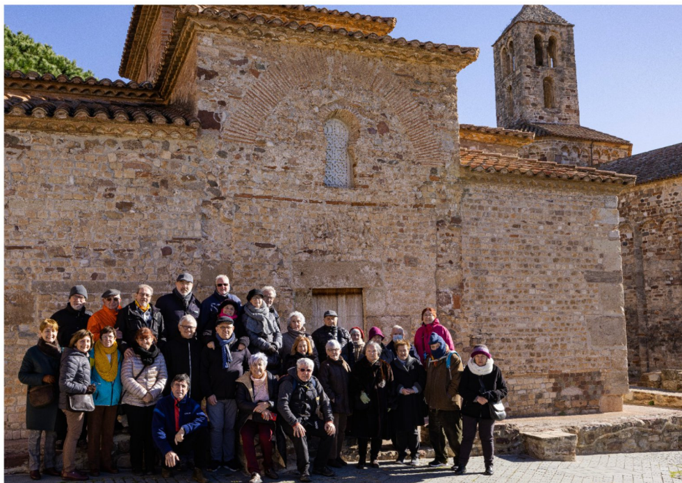
Cultura (pàg.9). Tot el grup a la Seu d'Egara.