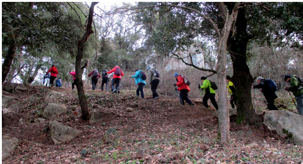
Senderisme: Serra de Sant Valentí - Olot (pàg. 6). Pujant a Sant Valentí.