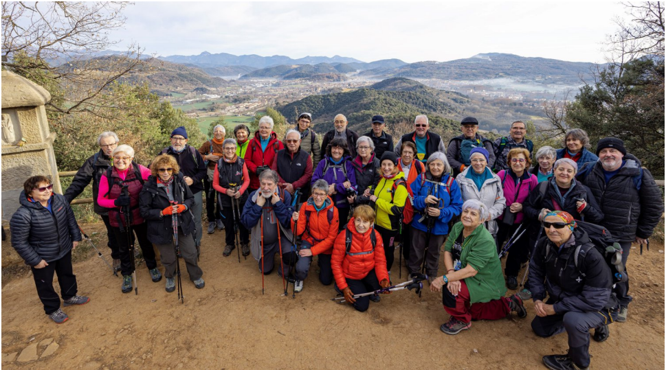
Cim de Sant Valentí.

Quan anem arribant a l'autocar s'ha girat un ventot ben desagradable i agraïm de poder entrar-hi. El viatge de tornada el fem en silenci i mig adormits, fins a l'entrada de la Meridiana, on una cançó que sona per la radio ens fa espavilar i acabem tots cantant i picant de mans. Un bon final per un dia ben agradable.