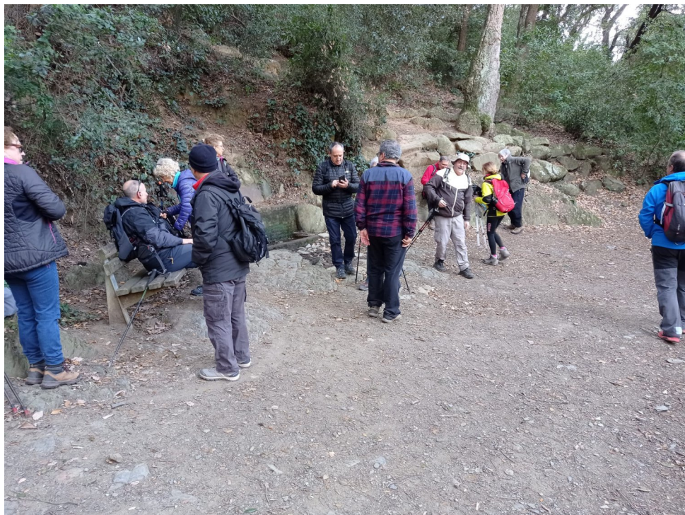
TTT. Matinal a Collserola (pàg. 8).