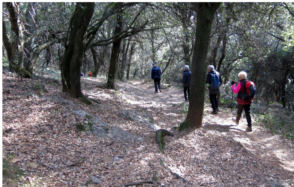
Senderisme. Serra de Sant Valentí-Olot (pàg.6).