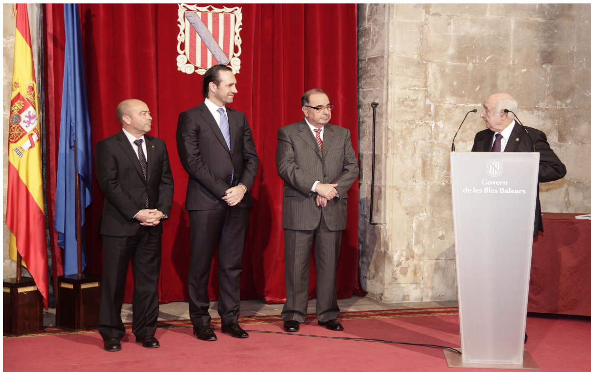
Acte de presentació de la Memòria de l'any 2012 a la seu de Presidència