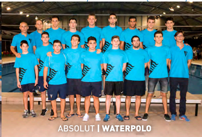
ABSOLUT | WATERPOLO