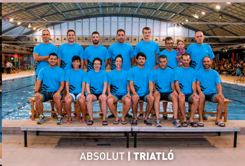
ABSOLUT | TRIATLÓ