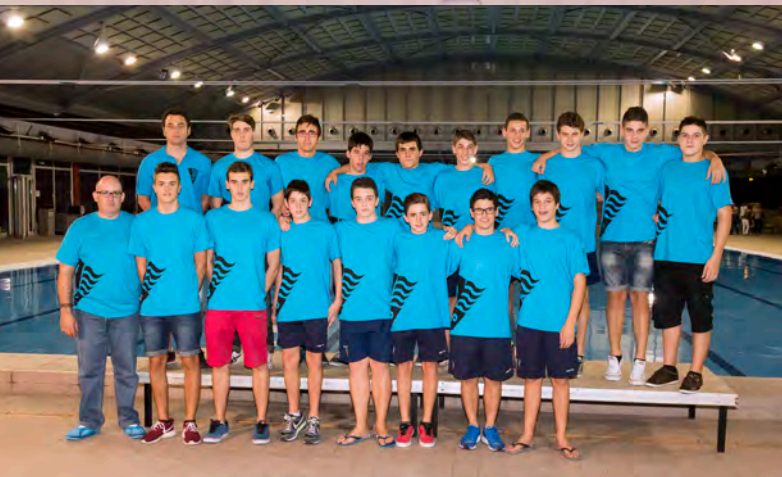
JUVENIL | WATERPOLO