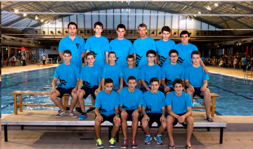
CADET | WATERPOLO