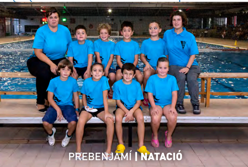
PREBENJAMÍ | NATACIÓ