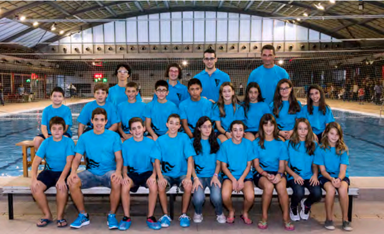
ALEVÍ INFANTIL JÚNIOR | NATACIÓ