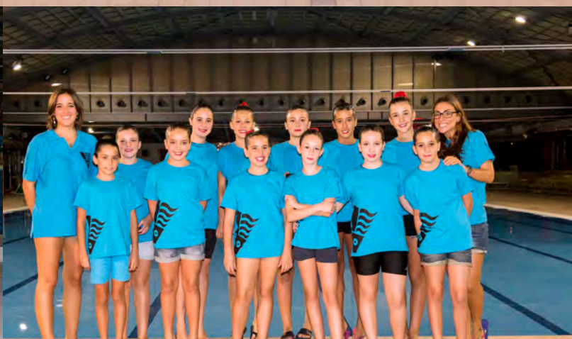
ALEVÍ | NATACIÓ SINCRONITZADA