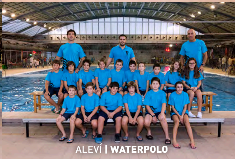
ALEVÍ | WATERPOLO