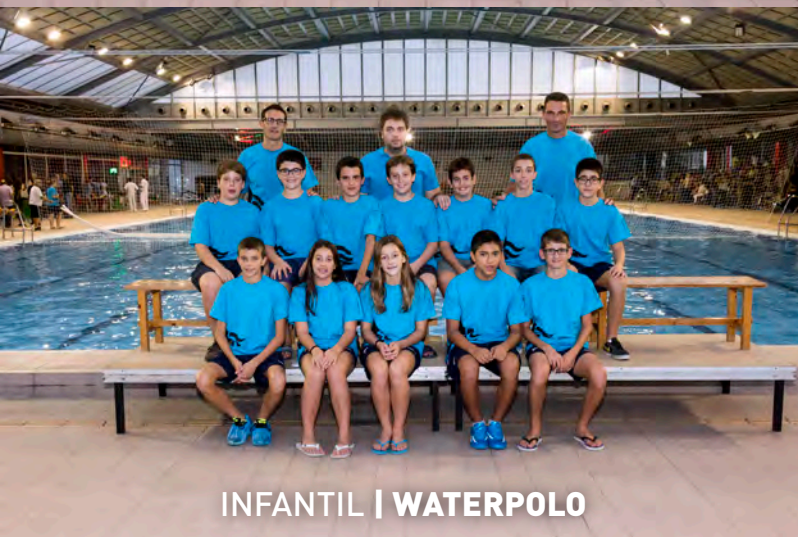
INFANTIL | WATERPOLO