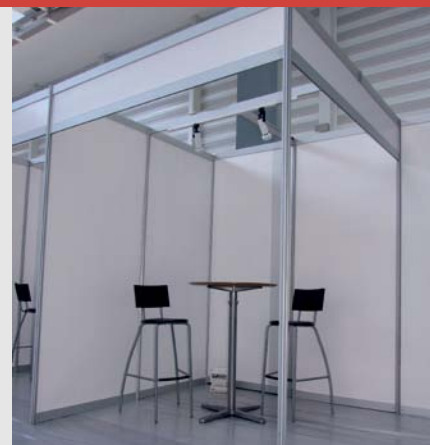
ESTAND MODULAR CANTONER 2x2 mts