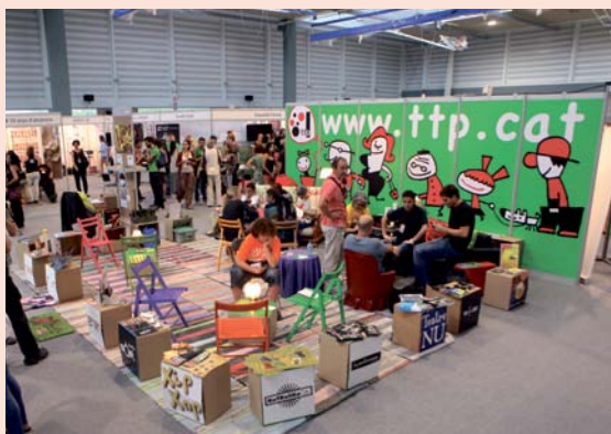
SUPERFÍCIE 6x6 mts