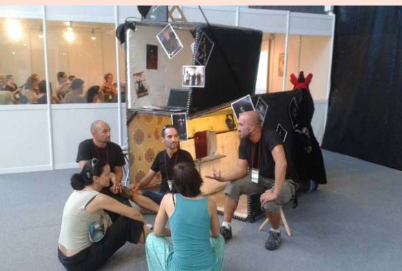
SUPERFÍCIE 2x2 mts