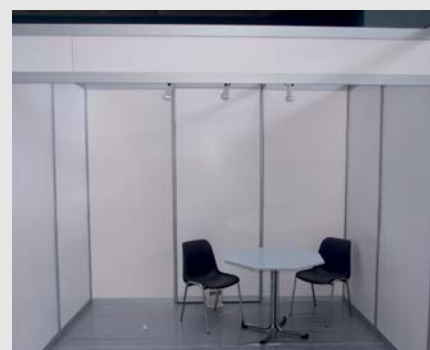
ESTAND MODULAR 3x2 mts