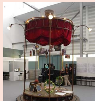
SUPERFÍCIE 3x3 mts