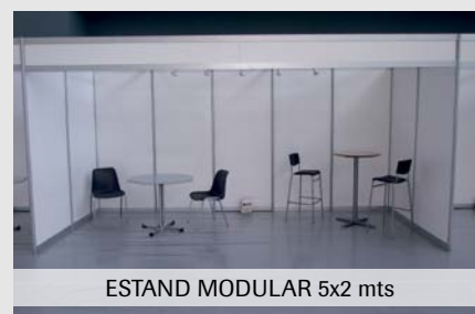
ESTAND MODULAR 5x2 mts