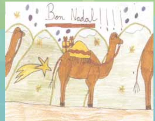
Alba Linazasoro i Tejero