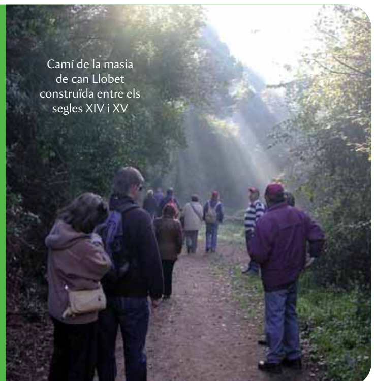
Camí de la masia de can Llobet construïda entre els segles XIV i XV