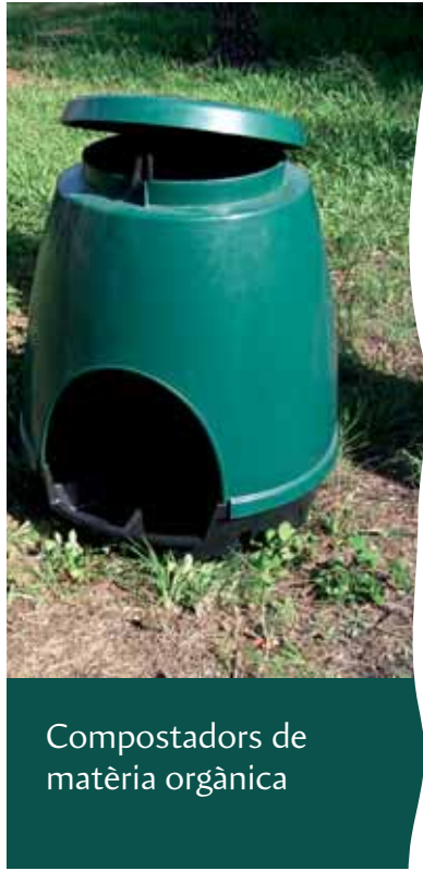
Compostadors de matèria orgànica

L'EMD ha emprès l'anàlisi de l'aforament de pous de propietat pública. Una vegada disposem dels resultats s'estudiarà l'ús més adequat d'aquesta aigua del subsòl.