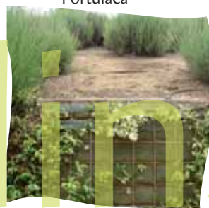
Sistema anti erosió