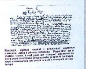
Traces del "Christiana Casati" de Christian Drobos

Dia_Hora: dimarts de 18.30 a 20h Cobrament mensual: 30.73 euros