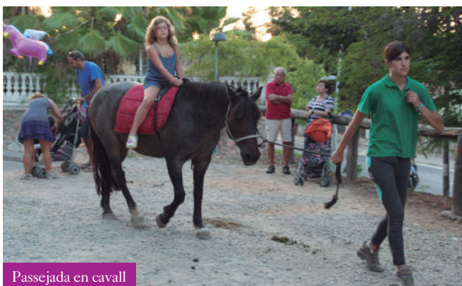
Passejada en cavall