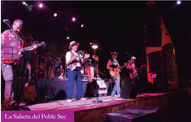
La Salseta del Poble Sec

Després de sopar l'activitat es va tornar a concentrar a la plaça del Casal de Cultura amb el Ball de Festa Major, a càrrec de la Salseta del Poble Sec, que un any més van ser els encarregats de posar a ballar els veïns de Vallldoreix amb la seva proposta musical de ritmes caribenys i èxits de tots els temps. El concert de l'orquestra barcelonina va animar el públic i va transformar la plaça en una gran pista de ball, on joves i grans van gaudir de la música fins a la matinada.