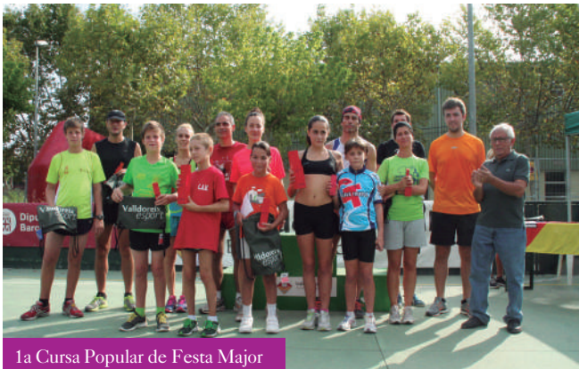
1a Cursa Popular de Festa Major

Després de sopar l'activitat es va tornar a concentrar a la plaça del Casal de Cultura amb el Ball de Festa Major, a càrrec de la Salseta del Poble Sec, que un any més van ser els encarregats de posar a ballar els veïns de Vallldoreix amb la seva proposta musical de ritmes caribenys i èxits de tots els temps. El concert de l'orquestra barcelonina va animar el públic i va transformar la plaça en una gran pista de ball, on joves i grans van gaudir de la música fins a la matinada.