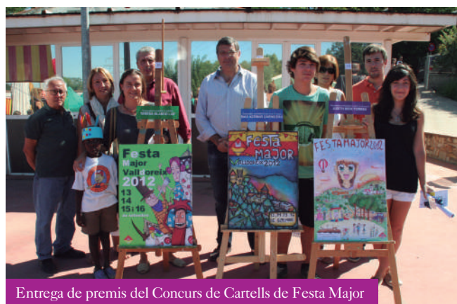
Entrega de premis del Concurs de Cartells de Festa Major

La matinal de dissabte va començar amb la trobada d'associacions veïnals i entitats culturals, el taller de pintura ràpida per a nens i nenes, la fira d'artesans i l'exposició dels cartells presentats al Concurs de Cartells de Festa Major. L'altre gran moment del matí va ser la Cercavila de Gegants i Grallers de Valldoreix, el Ball de Gegants, el lliurament de premis del Concurs de Cartells de Festa Major, les activitats d'observació solar i la xerrada 'L'univers a l'abast dels més petits', organitzades per l'Ass. Astronòmica Valldoreix-Sant Cugat. Els esports també van ser protagonistes amb la Jornada Recreativa Aquàtica del Complex Esportiu; la presentació dels clubs federats de Valldoreix, les activitats de l'Esport d'Entitats al