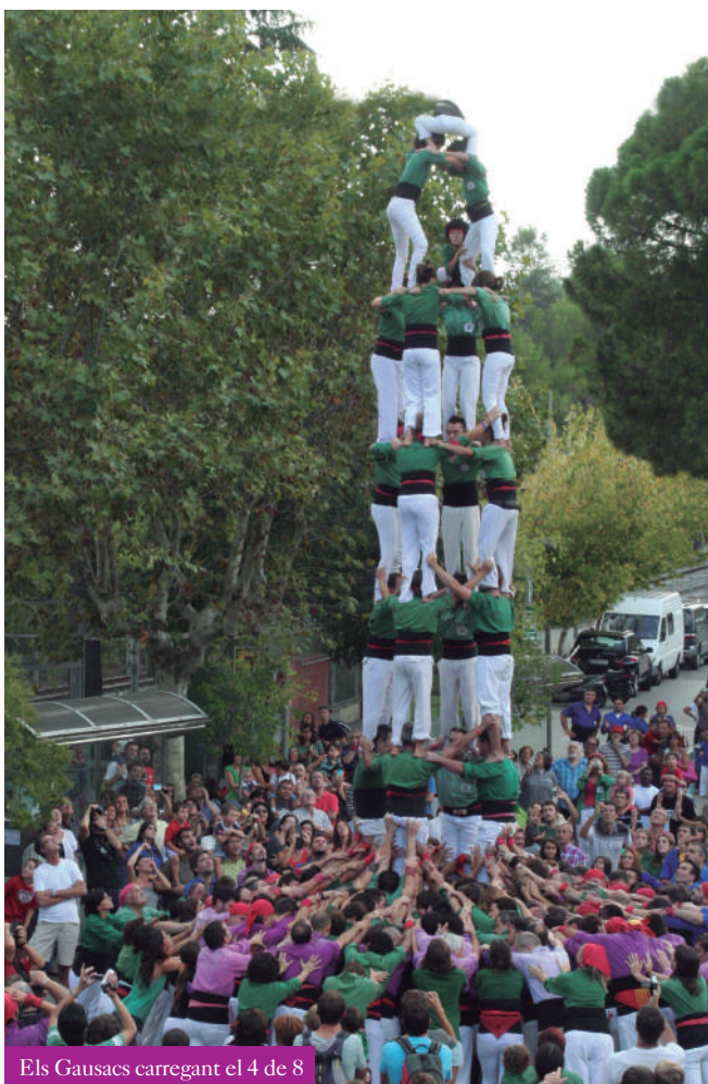
Els Gausacs carregant el 4 de 8