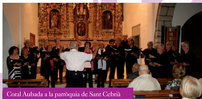
Coral Aubada a la parròquia de Sant Cebrià