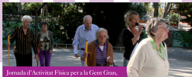
Jornada d'Activitat Física per a la Gent Gran,