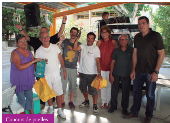
Concurs de paelles

La intensa activitat matinal va obrir la gana i va animar a la gent a participar al Concurs de Paelles organitzat pel Casal d'Avis. Prop de 300 persones, entre adults i petits es van donar cita a l'esdeveniment gastronòmic i que van poder tastar les 9 paelles que van prendre part del concurs.