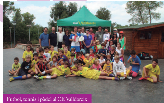
Futbol, tennis i pàdel al CE Vallldoreix