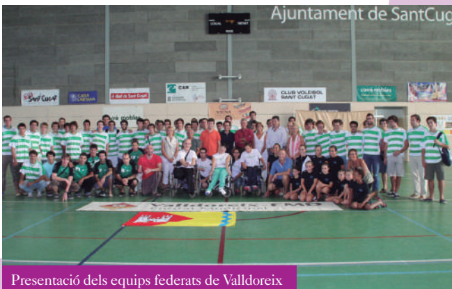
Presentació dels equips federats de Vallldoreix