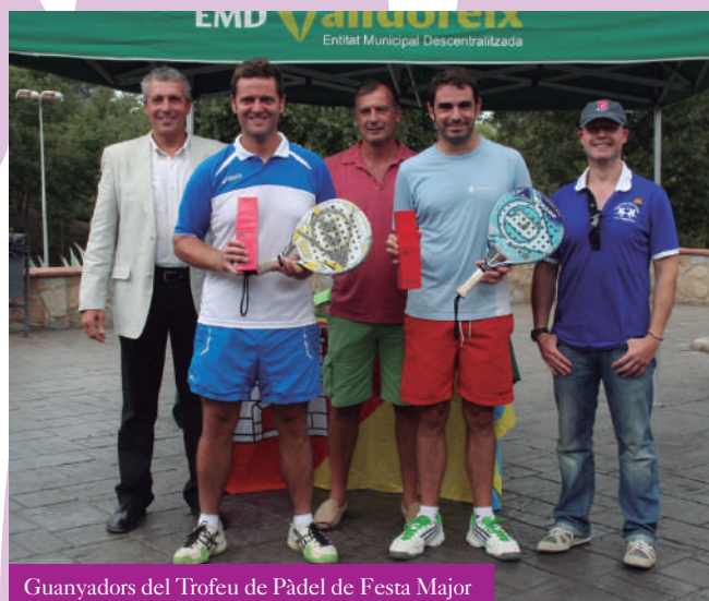
Guanyadors del Trofeu de Pàdel de Festa Major

Les activitats del diumenge de Festa Major es van completar amb el Balontir a la plaça del Casal, amb les entregues de premis dels trofeus de la Jornada de Futbol Base i de Tennis i Pàdel, al CE Valldoreix.