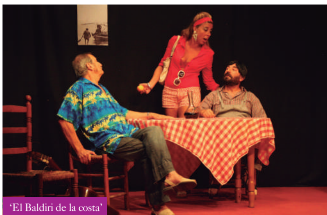
'El Baldiri de la costa'

El final de 'El Baldiri de la costa' va donar lloc a l'inici de la Sardinada Popular Ecològica, preparada pels membres de l'Ass. De Veïns i Veïnes Progressistes, que van cuinar sardines per a tots els assistents.