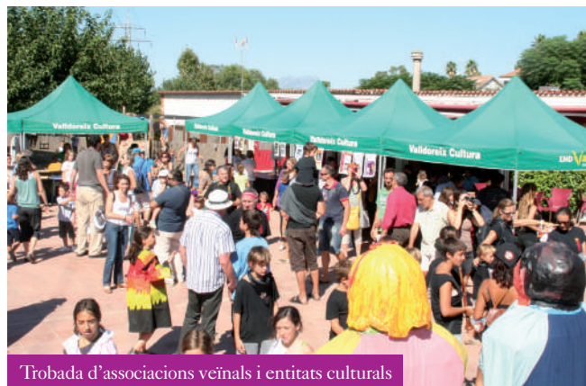
Trobada d'associacions veïnals i entitats culturals