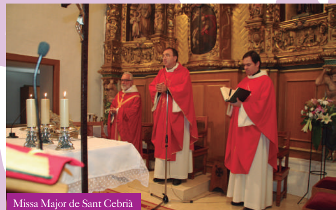
Missa Major de Sant Cebrià