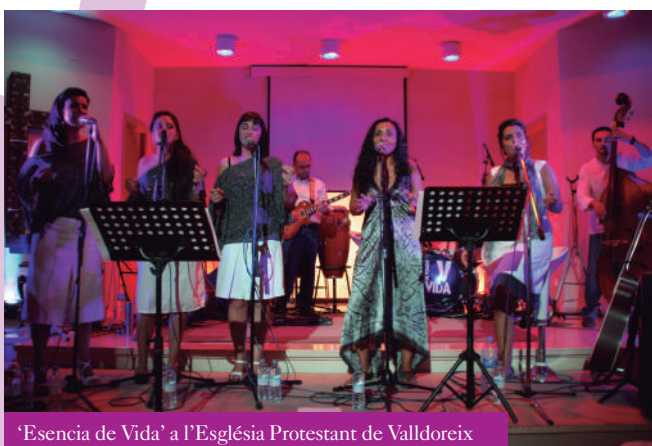
'Esencia de Vida' a l'Església Protestant de Valldoreix

El final de 'El Baldiri de la costa' va donar lloc a l'inici de la Sardinada Popular Ecològica, preparada pels membres de l'Ass. De Veïns i Veïnes Progressistes, que van cuinar sardines per a tots els assistents.