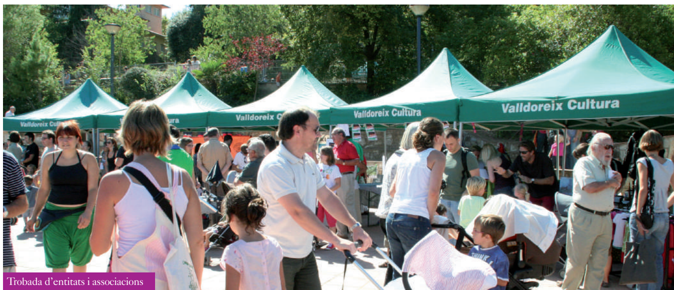
Trobada d'entitats i associacions

Centenars de veïns de Valldoreix, acompanyats de familiars, amics i coneguts, sense oblidar els visitants, es van llençar al carrer els dies 13, 14, 15 i 16 de setembre per gaudir al màxim d'una nova edició de la festa grossa de la vila. Com cada any, la Festa Major de Valldoreix va oferir un programa d'actes farcit d'activitats per a tots els públics, que van fer les delícies de grans i petits al llarg dels quatre dies de festa.