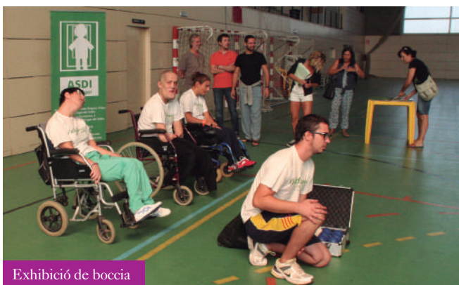
Exhibició de boccea