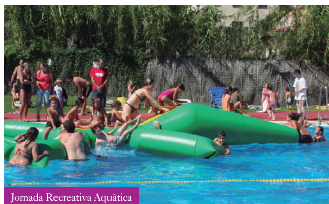
Jomada Recreativa Aquàtica