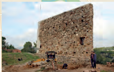
Castell de Canals