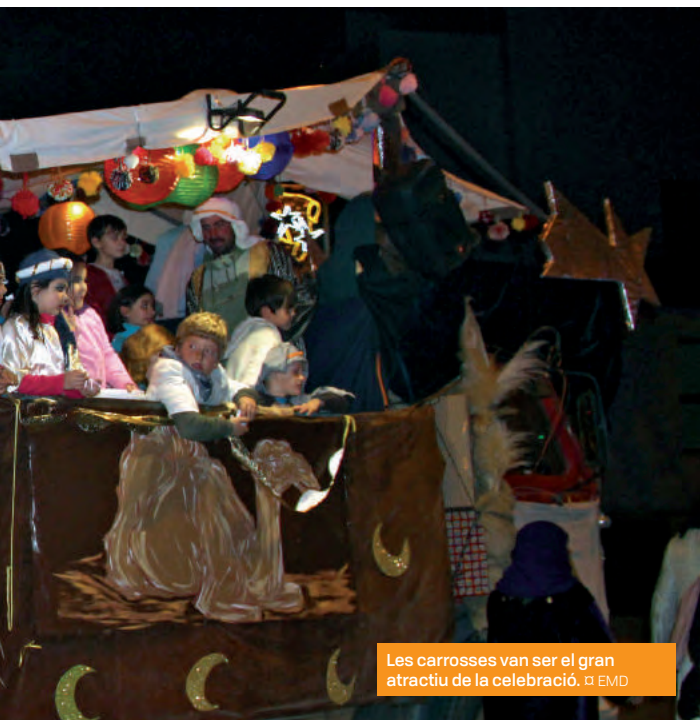
Les carrosses van ser el gran atractiu de la celebració.

L'activitat va ser molt animada durant tota la tarda, ja que molt abans de l'arribada dels Reis es van organitzar tallers de manualitats pel públic infantil