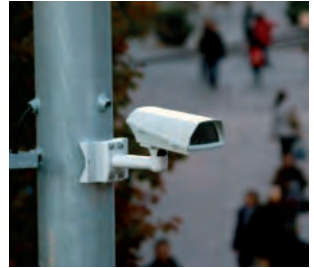
Es un dels projectes que estan a l'agenda de l'equip de govern. □ EMD

Les gestions fetes per l'equip de govern de Valldoreix amb l'executiu municipal de Sant Cugat han aconseguit el compromís de l'Ajuntament per a la intensificació i millora de les tasques de patrullatge a la vila, amb l'emplaçament de càmeres de videovigilància als accessos a Valldoreix i la incorporació d'un dron de la Policia Local al dispositiu de lluita contra els robatoris en domicilis.