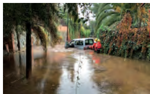
Imatge durant una inundació a Valldoreix.

L'Entitat Municipal de Valldoreix va enllestir al gener les tasques d'ampliació de les reixes dels embornals de l'Av. Ramon Escayola i del carrer Parc i la reparació de dos talussos finals de la riera d'en Nonell a l'alçada del carrer Canari, afectats per les fortes pluges del novembre.