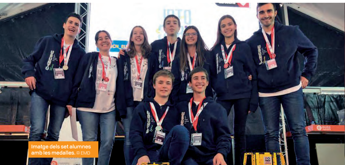
Imatge dels set alumnes amb les medalles.