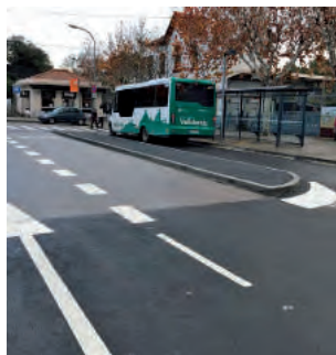
Imatge de la plaça de l'Estació un cop dutes a terme les obres.

L'EMD-Valldoreix va enllestir al desembre les tasques d'endreçament de la mobilitat de la zona de la Pl. de l'Estació. L'acció va consistir en l'ampliació de l'àrea dedicada al servei del bus urbà i en l'ordenació de la circulació de vehicles.