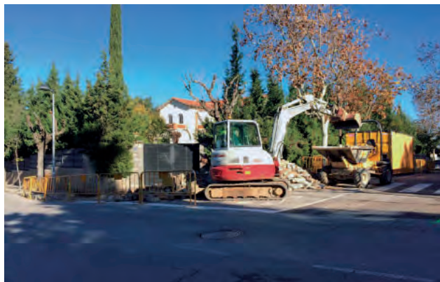
Imatge de les obres.

L'Entitat Municipal de Valldoreix va començar al novembre de l'any passat la segona fase de les obres de reforma i millora de les cruïlles del passeig Rubí. L'acció, ja enllestida, té l'objectiu d'emfatitzar la seguretat a les