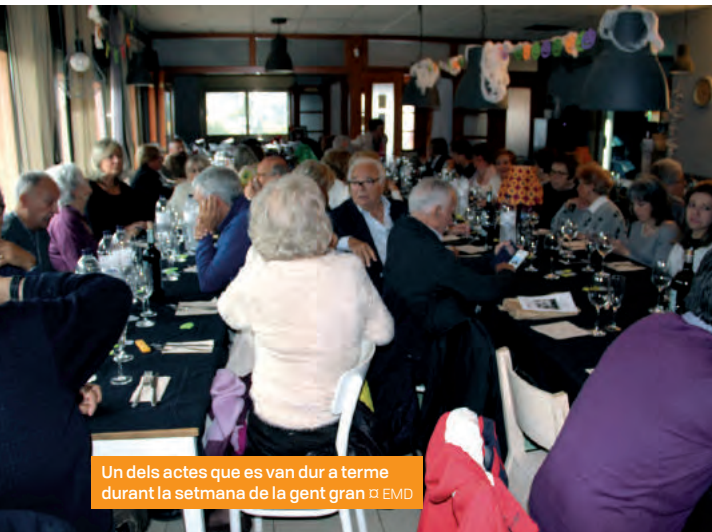
Un dels actes que es van dur a terme durant la setmana de la gent gran □ EMD