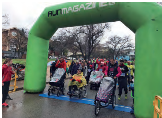
Malgrat el fred i la pluja, gran participació a la milla solidària. □EMD

La pluja i el fred no van desanimar les més de 150 persones que es van donar cita a la línia de sortida de la 3a Milla Solidària de Valldoreix el 20 de gener per participar en la cursa i sumar esforços en la campanya solidària de la ràdio marató Cap Nen Sense Juguina, per portar regals als infants hospitalitzats i amb manca de recursos.