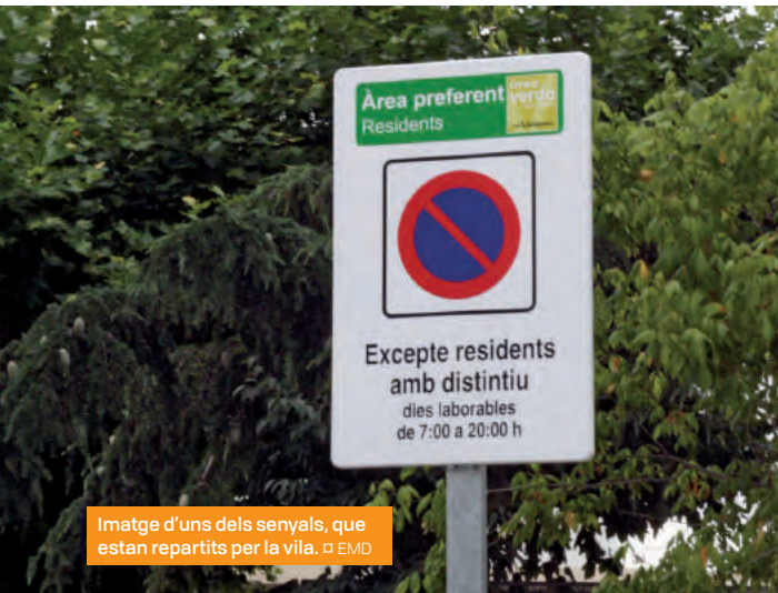
Imatge d'uns dels senyals, que estan repartits per la vila. □ EMD