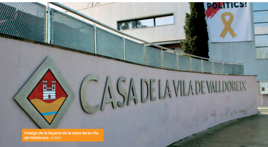
Imatge de la façana de la casa de la vila de Valldoreix.