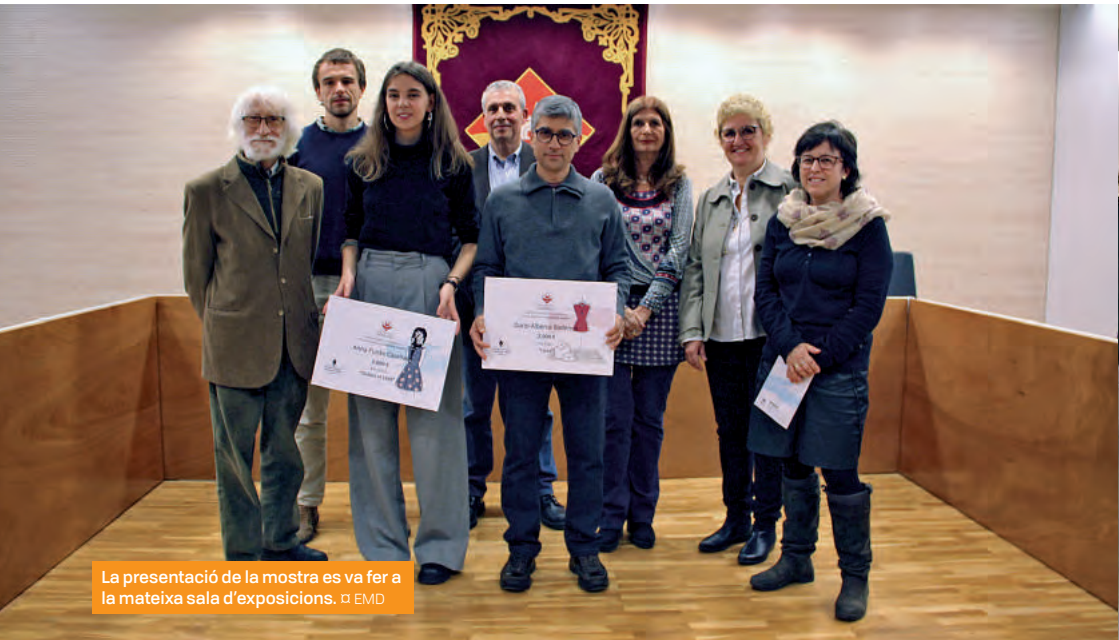
La presentació de la mostra es va fer a la mateixa sala d'exposicions. □ EMD