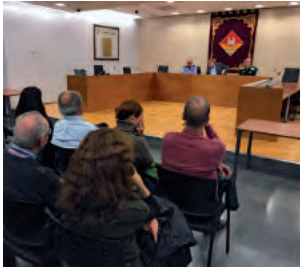
Veïns i veïnes van discutir temes de seguretat a la sala de plens. □ EMD

Les 5 reunions convocades des de l'EMD de Valldoreix van comptar amb la col·laboració de les oficines de relacions amb la comunitat del cos de Mossos d'Esquadra i de la Policia Local de Sant Cugat.