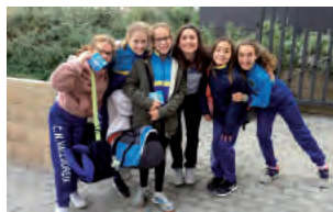
L'equip es va fer un lloc durant la fase classificatòria.

L'equip de nedadores del club valldoreixenc es va presentar divendres 18 de gener a les instal·lacions esportives del barceloní Club Kallipolis per fer-se amb un lloc a les proves del Campionat d'Espanya en categoria alevina.