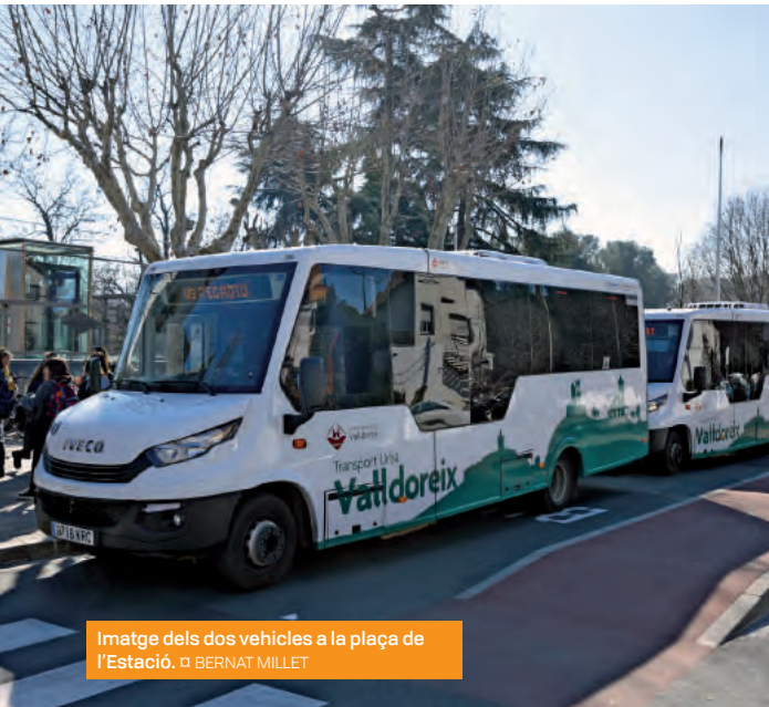
Imatge dels dos vehicles a la plaça de l'Estació.